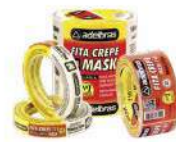
710 Fita Mask Crepe Masking Tape