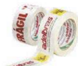
Composição, uso e informações adicionais na pág. 15