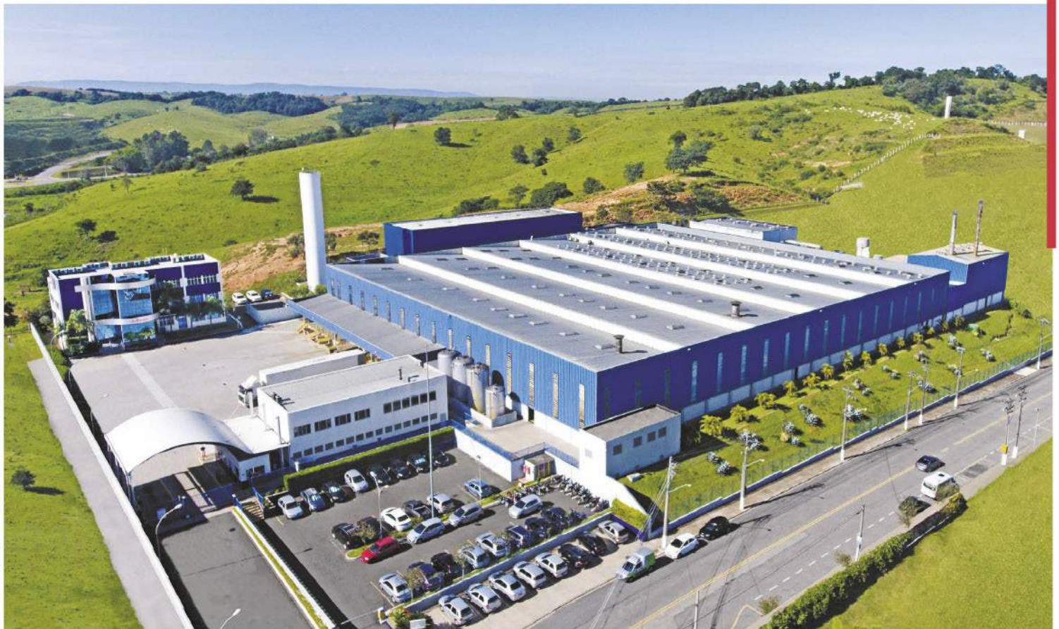
Planta de Vinhedo com 20mil m 2 - SP